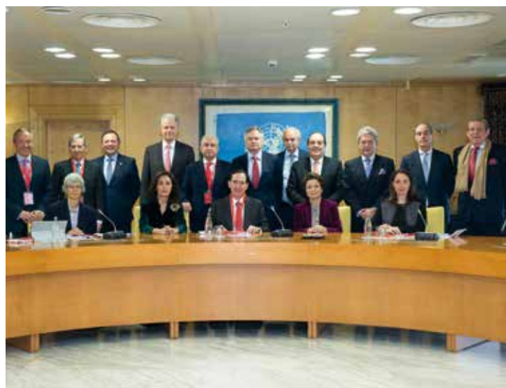
El Consejo de Administración de MAPFRE S.A. celebra una reunión en los momentos previos a la junta